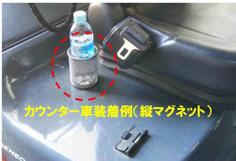
カウンター車装着例(縦マグネット)