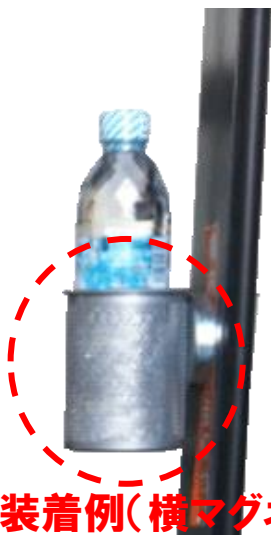
リーチ車装着例(横マグネット)